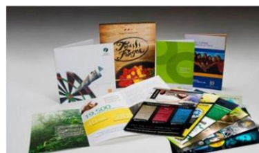
Imagen empresarial. Logotipos y tarjetas, membretes, sobres