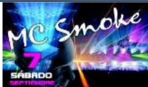
Módulo 7 Diseño publicitario fullcolor Volantes y folletos