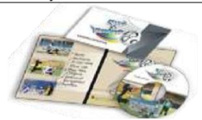
Módulo 10 Comercialización Portfolios de trabajo navegable