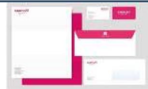
Módulo 6 Imagen Empresarial Logotipos y tarjetas