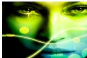
Módulo 2 Fotocomposición digital Trucos y efectos