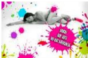
Módulo 1 Trabajo con imágenes y fotos Retoques básicos