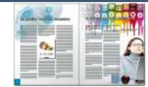
Módulo 9 Diseño Editorial Maquetación de revistas y libros