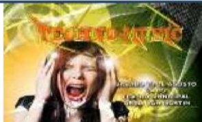
Módulo 4 Diseño artístico Comunicación visual