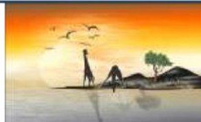
Módulo 5 Dibujo Vectorial Caricaturas y poster